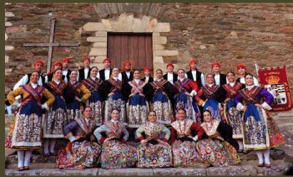
Grupo de Danzas “Doña Urraca”

Todo este trabajo de base ha tenido sus frutos a lo largo de los años y el resultado es la promoción y el conocimiento de la Danza y Música Tradicional de Zamora por parte de los jóvenes zamoranos que han pasado por esta Escuela desde entonces, así como experiencias personales y colectivas impagables, llevando el nombre de Zamora por todo el mundo.