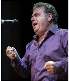
ANTONIO RONCO, cantaor (La Algaba, Sevilla, 1958)