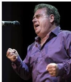
ANTONIO RONCO, cantaor (La Algaba, Sevilla, 1958)